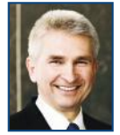
Prof. Dr. Andreas Pinkwart Min. f. Wirtschaft, Innovation, Digi- talisierung und Energie NRW